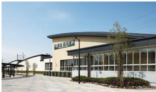
カーボン・ニュートラル・ステーション