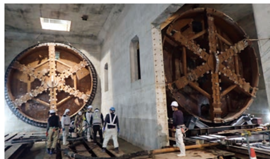
北大阪急行線延伸事業 日本建設業連合会 日建連表彰2023 第4回土木賞受賞