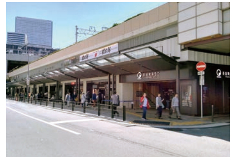
商業施設 茶屋町あるこ