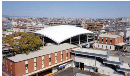
阪神甲子園駅 令和元年度 第21回兵庫県人間サイズのまちづくり奨励賞受賞