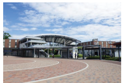
安全・快適な駅への改良