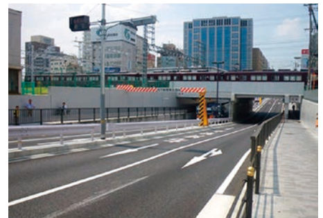
交通の円滑化 淀川北岸線の道路アンダーパス(阪急十三駅付近)