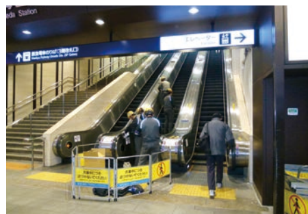
鉄道施設の安全確保