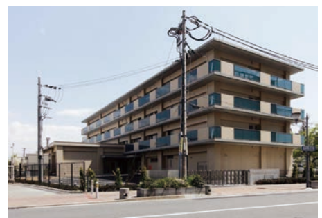
独身寮・研修施設 正大塾