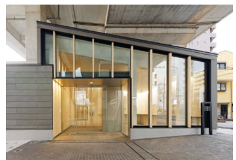
阪急バス本社事務所 阪急バス