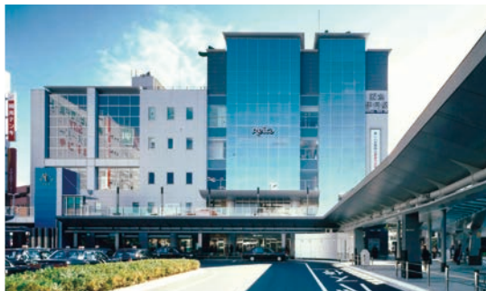
阪急伊丹駅 第1回兵庫県人間サイズのまちづくり賞 震災復興特別賞受賞 土木学会関西支部技術賞奨励賞受賞