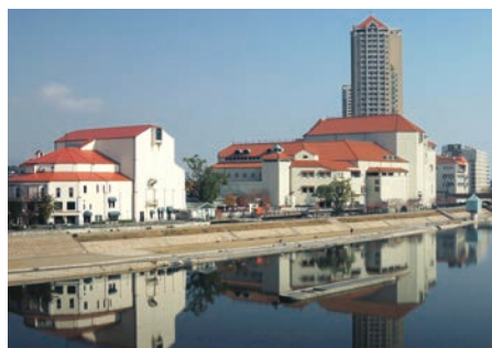
耐震・設備改修 宝塚大劇場・パウホール