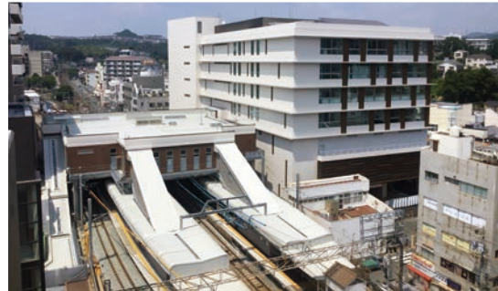
神戸電鉄鈴蘭台駅橋上駅舎化工事

阪急摂津市駅では太陽光発電やLED照明や壁面とホーム背壁の緑化など、また、阪神競馬場のパドックでは気化熱を利用して気温を下げる「ドライミスト」を設置するなど、地球環境に優しい設計ノウハウも豊富です。