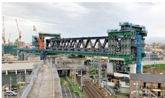
淡路駅周辺連続立体交差工事

当社は、淡路駅付近連続立体交差事業や北大阪急行線延伸事業など、大規模な社会インフラ整備のプロジェクトにも関与しております。調査・計画段階から関わり、概略設計や詳細設計だけでなく、測量や土質調査、各種協議への協力から工事監理まで幅広く担当しています。