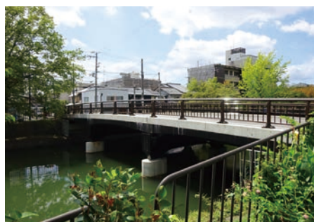
土木遺産橋梁の改修・耐震補強