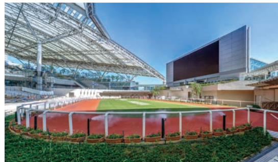
ドライミスト設置