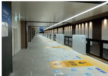
安全・快適な駅への改良