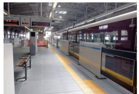
安全な駅への改築