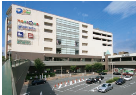
第15回 大阪心ふれあうまちづくり賞 大阪府知事賞 阪急山田駅・デュー阪急山田