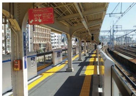
安全な駅への改築