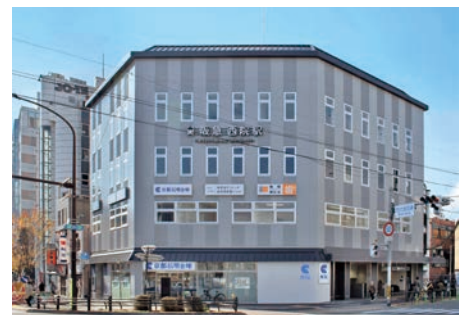
鉄道駅施設 阪急西院ビル