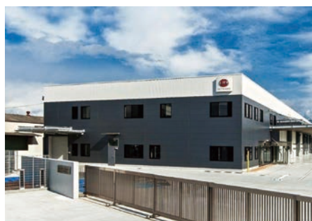
物流施設 UDTラックス奈良