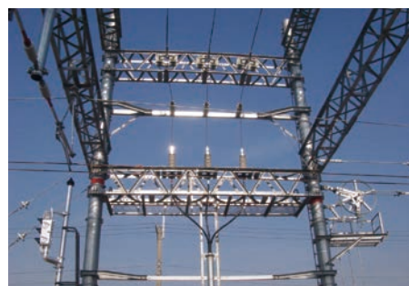
鉄道施設の安全確保