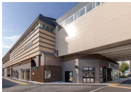
高架化事業・高架下商業施設 阪急洛西口駅・TauT洛西口