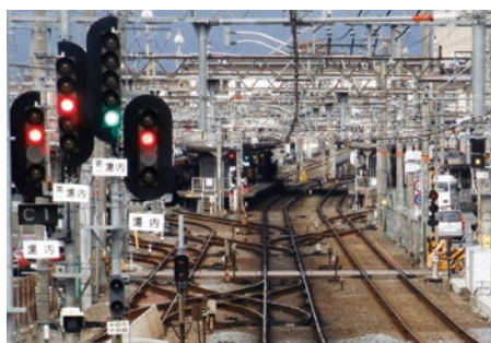
鉄道施設の安全確保

鉄道は、安全で快適な旅客輸送機関です。その鉄道施設のうち、電気設備(変電所・電力線路・電力付帯・信号保安・通信)に関する調査、設計(概略・比較・基本・実施)及び工事監理を行っています。